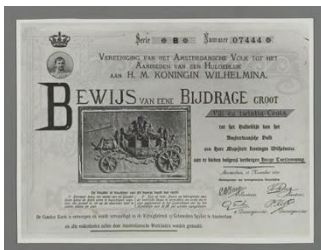
Bewijs van bijdrage, Stadsarchief Amsterdam

Het idee voor de Gouden Koets ontstond in een stad in verandering. De tentoonstelling neemt de bezoeker allereerst mee naar het Amsterdam van het eind van de negentiende eeuw, dat na een lange periode van stilstand in razend tempo uitgroeide tot een moderne en zelfbewuste hoofdstad. Waar tot voor kort stadsmuren hadden gestaan verrezen treinstations, fabrieken, luxe hotels en nieuwe wijken. In dertig jaar tijd verdubbelde het aantal inwoners, mede door de komst van grote aantallen plattelandsbewoners. Wat deelden de Amsterdammers nog met elkaar? Vrouwen en arbeiders streefden naar een volwaardige positie, jongeren zochten hun eigen weg en ook in de kerken was het onrustig. De behoefte aan een verbindend symbool groeide: Oranje. Koning Willem III (1817-1890) bracht echter weinig mensen in vervoering. Zijn jonge dochter, koningin Wilhelmina (1880-1962), sprak meer tot verbeelding. Tijdens de acht jaar durende aanloop naar haar meerderjarigheid en inhuldiging groeide de wens haar met de hele stad een cadeau te geven.