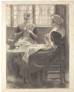
'Twee zittende weesmeisjes met naaiwerk', Van der Waay Collectie Amsterdam Museum.

In deze zaal draait het ook om de makers van de Gouden Koets. Een indringende fotoserie toont de ambachtslieden die de koets maakten. Twaalf mannen werkten in de fabriek Spyker bijna twee jaar lang aan de koets. In de audiotour maakt de bezoeker kennis met een van hen, bankwerker C.H. Bos. De bezoeker ontmoet via prenten en schilderijen de dames van Tesselschade, Arbeid Adelt en de meisjes uit het burgerweeshuis, het gebouw waar nu het Amsterdam Museum is gevestigd. Samen waren zij verantwoordelijk voor het borduurwerk van het gehele interieur van de koets. Ruim 15 miljoen steekjes. Hoewel de koets voor de eerste vrouw op de troon bestemd was, waren zij de enige vrouwen die een ambachtelijke bijdrage leverden. Ook wordt in de zaal gedetailleerd aandacht besteed aan het restauratieproces van de Gouden Koets in de afgelopen jaren.