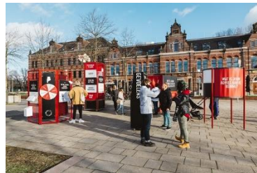
'Mobiele onderzoekinstallatie Gouden Koets.'