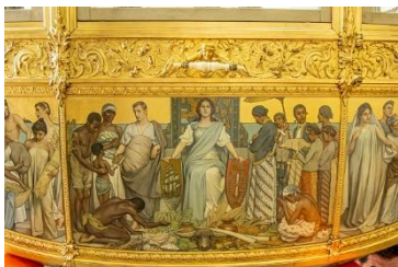
Paneel 'Hulde der Koloniën'

Op de koets staan verschillende verwijzingen naar de koloniën, waaronder het veelbesproken paneel 'Hulde der Koloniën' geschilderd door Nicolaas van der Waay. Om die verwijzingen en het beeld dat destijds over de koloniën bestond te begrijpen wordt in de tentoonstelling De Gouden Koets gekeken naar de koloniale tentoonstelling uit 1883 op het Museumplein. Zo'n anderhalf miljoen Nederlanders maakten op deze Wereldtentoonstelling kennis met de koloniën. De bedenkers en makers van de Gouden Koets waren daar ook aanwezig. De broers Spijker stonden er met rijtuigen en Nicolaas van der Waay schilderde allegorische portretten voor een van de paviljoens. Dit werpt de vraag op in hoeverre zij de verbeelding van de koloniën op de Gouden Koets baseerden op de Wereldtentoonstelling van 1883. In de tentoonstelling De Gouden Koets wordt een veelzijdige selectie van wat de broers Spijker en Van der Waay gezien moeten hebben getoond: een overdaad aan producten, grondstoffen en cultuuruitingen. De ambitie van de organisatoren: 'moderne Westerse beschaving brengen in de koloniale wildernis, en de koloniale wildernis laten zien aan het moderne beschaafde publiek in Amsterdam'. Daarom werden ook koninkrijksgenoten uit Indië en Suriname tentoongesteld. Kunstenaar Nelson Carrilho, nazaat van een van de mensen uit Suriname die gepresenteerd werd op de wereldtentoonstelling, reflecteert met zijn werk op de koloniale tentoonstelling en het kolonialisme.