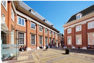
Binnenplaats Amsterdam Museum.

Na al die verhalen over en perspectieven op de Gouden Koets heeft de bezoeker de gelegenheid de koets in alle rust buiten te bekijken. Het rijtuig staat opgesteld in een speciale glazen behuizing waar bezoekers omheen kunnen lopen en zo de koets van alle kanten kunnen bezichtigen. Middels de audiotour wordt door diverse personen toegelicht wat er precies op de koets te zien is en hoe dat kan worden geïnterpreteerd.